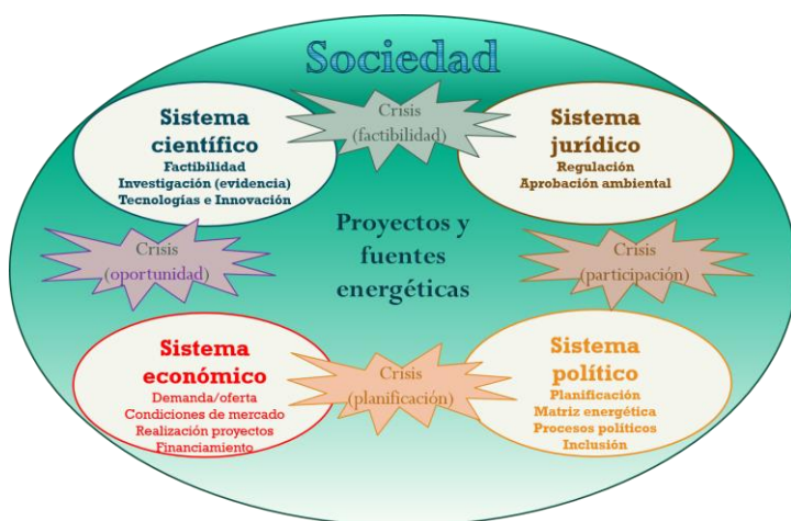
Estructura de la tematización social de las ERNC: tematizaciones funcionales y rol de la crisis.

Las descripciones mediáticas del medioambiente y sus relaciones con la sociedad se ha vuelto un campo de estudio crecientemente relevante; sin embargo, predomina una tendencia a centrarse en la tematización de problemas y no de posibles soluciones, y a adoptar una postura normativa y jerarquizante respecto a la tematización mediática. Frente a ello, la tesis propone entender este proceso como una construcción autónoma de realidad que los medios de comunicación de masa realizan como parte de su función comunicativa dentro de la sociedad moderna. Aplicando esta postura a la tematización de proyectos ERNC en periódicos digitales chilenos, por medio de un análisis de contenido con enfoque mixto, se logra observar la emergencia de estructuras temáticas únicas y entrelazadas, correspondientes a los sistemas político, científico, económico y del derecho, entre las que se mueve y prolifera la idea de crisis energética, y a las que se apoya la instalación del medioambiente como problema socialmente relevante y observable (aunque tratado superficial y fragmentariamente). Comprender la racionalidad y estructuras de la tematización mediática es relevante para toda institución -como el (CR)2- que busque posicionarse comunicacionalmente en los medios y, por medio de aquellos, en la opinión pública.