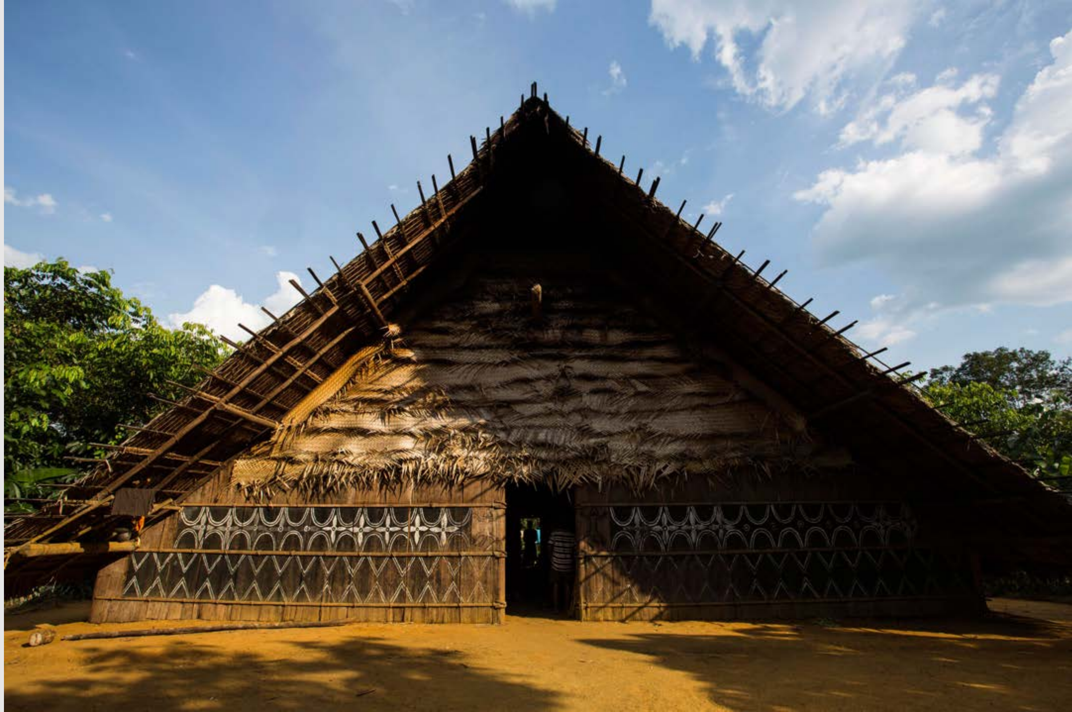
Maloca de la Selva